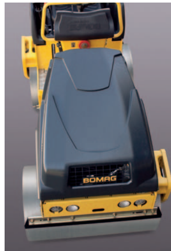
100% „seitenfreie“ Walzen durch einseitig aufgehängene Bandagen inkl. gleichzeitigem Versatz von 60 mm.