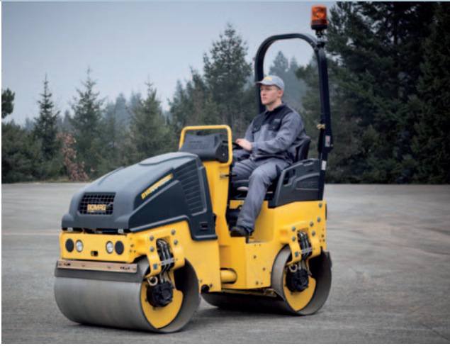
Die wohl robusteste Walze der Welt...