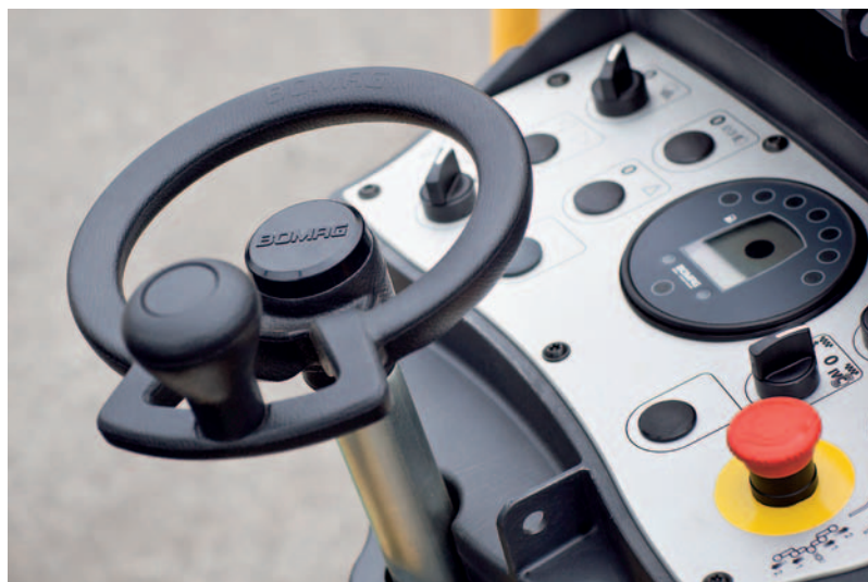
Das übersichtliche Armaturenbrett sowie Smart-Drive-Lenkrad – Garant für intuitive und sichere Bedienung der Walze.