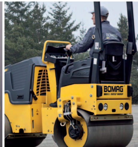
Fahrerstand mit hohem Wohlfühlwert – großzügig & komfortabel.