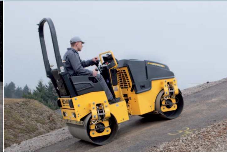
... meistert ihre Verdichtungsanforderungen im Asphalt- und Erdbau.